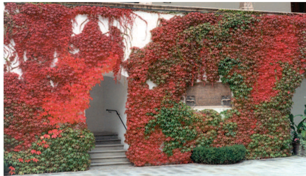
Herbst im Arkadenhof