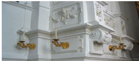
In der Marienkapelle

Alle Seelsorger/innen, unabhängig von ihrer derzeitigen Tätigkeit oder Verwendung können daran teilnehmen. Eine Grundqualifizierung, wie sie in der Weiterbildung „Führen und Leiten in der Kirche“ angeboten wird, ist nicht vorausgesetzt.