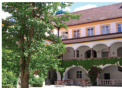
Arkadenhof im Kardinal-Döpfner-Haus

Die Werkstatt für zeitsensible Gottesdienstformen bietet den Teilnehmenden die Möglichkeit, auf der Basis fundierter theologischer Reflexionen zeitgemäße und an den Möglichkeitsbedingungen heutiger Menschen orientierte Ausdrucksformen liturgischer Gestaltung zu entwickeln. Die Arbeitsweise ist prozessorientiert und experimentell.