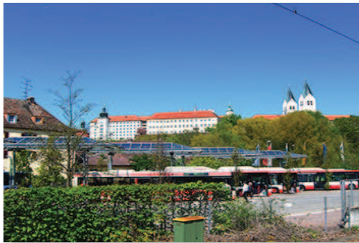
Blick vom Bahnhof auf den Domberg

Sie lernen in dieser Fortbildung Konzepte rund um die Begriffe „Orientierung“, „Werte“ und „Sinn“ kennen. Sie werden dafür sensibilisiert, das Bedürfnis nach selbstbestimmter Sinn-Findung in Ihrer Arbeit zu berücksichtigen. Indem Sie Methoden der Orientierungsfindung in Gruppen und im seelsorglichen Gespräch einüben, gewinnen Sie Handlungssicherheit bei der Begleitung von Menschen in Entscheidungssituationen.